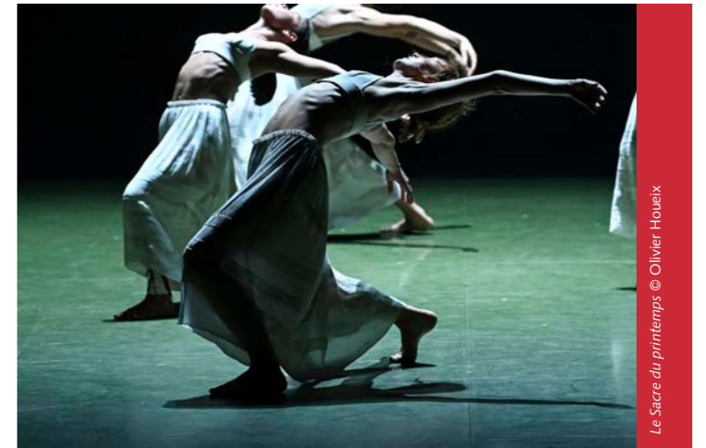
Le Sacre du printemps