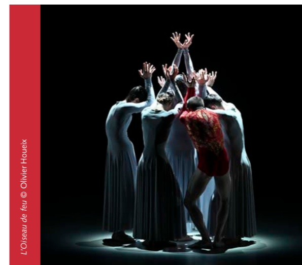
L'Oiseau de feu

Selon la théorie « des six poignées de main » du hongrois Frigyes Karinthy, toute personne dans le monde peut être reliée à n'importe quelle autre, au travers d'une chaîne de relations individuelles comprenant au plus, six personnes. Avec l'avènement des réseaux sociaux et de la mondialisation, le degré de séparation ne serait plus que de trois personnes. On serait alors tenté d'affirmer que la danse – comme d'ailleurs, d'autres disciplines artistiques – a aussi ce merveilleux pouvoir de relier les êtres au-delà du temps qui passe et par-delà les contingences de l'époque.