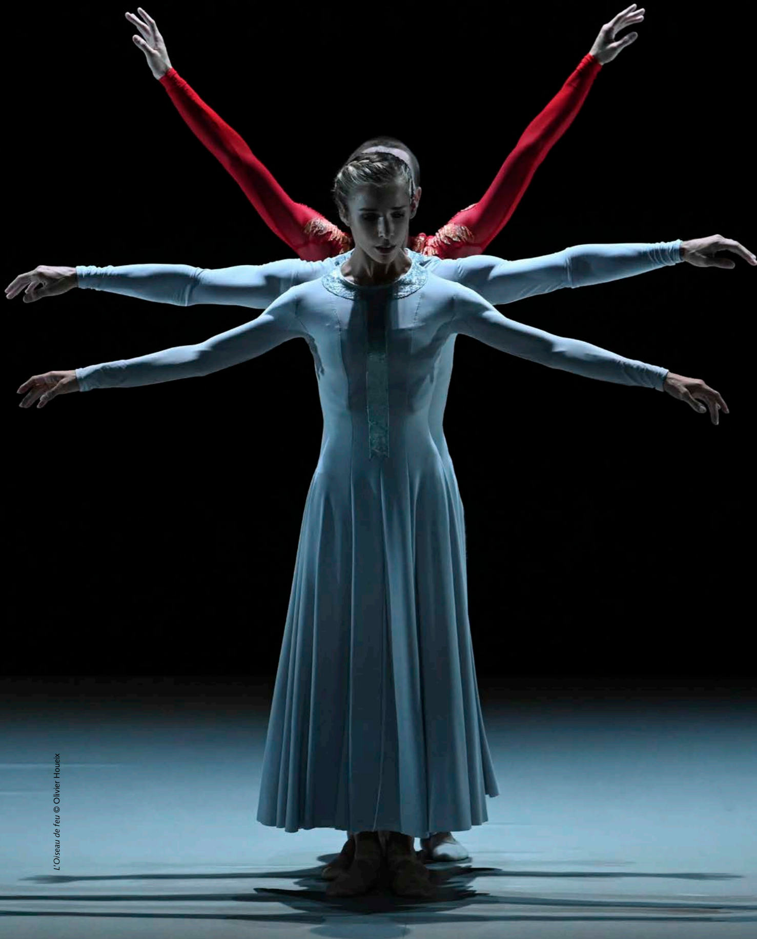
L'Oiseau de feu © Olivier Houeix