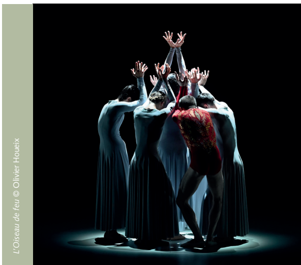
L'Oiseau de feu

Según la teoría de los "seis eslabones de separación" del húngaro Frigyes Karinthy, cualquier persona de la tierra puede estar conectada a cualquier otra persona del planeta a través de una cadena de relaciones individuales que comprende, como máximo, a seis personas. Con el advenimiento de las redes sociales y de la globalización, el grado de separación no sería más que de tres personas. En consecuencia, podríamos caer en la tentación de afirmar que la danza -como cualquier otra disciplina artística- también tiene ese poder de unir a las personas, más allá del tiempo transcurrido y más allá de las contingencias de la época.