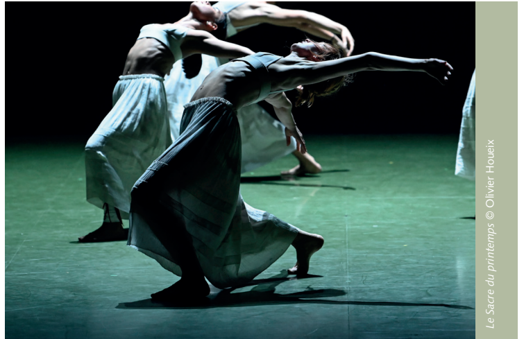
Le Sacre du printemps