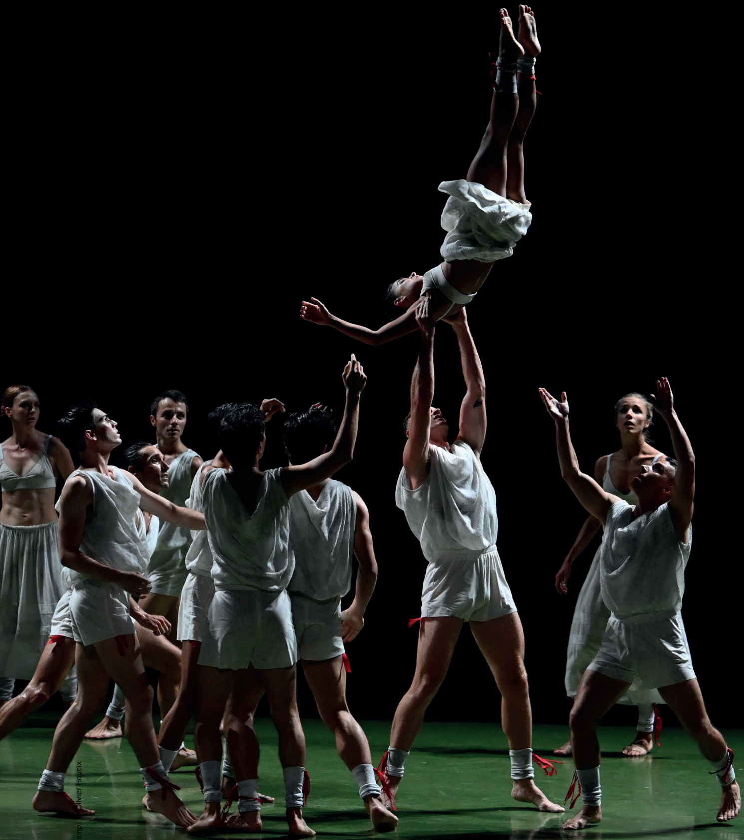
Le Sacre du printemps Olivier Huetix