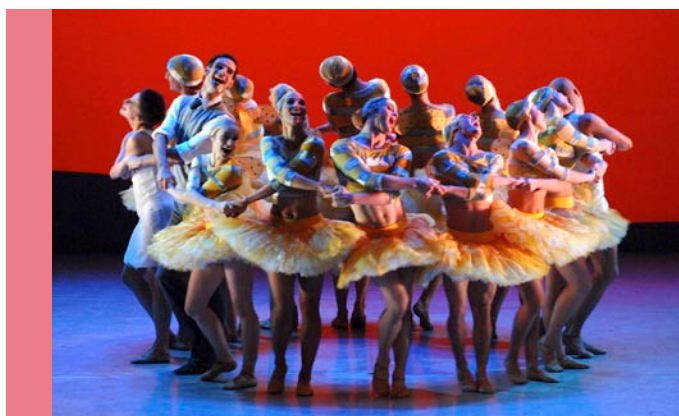
Casse Noisette | Malandain Ballet Biarritz