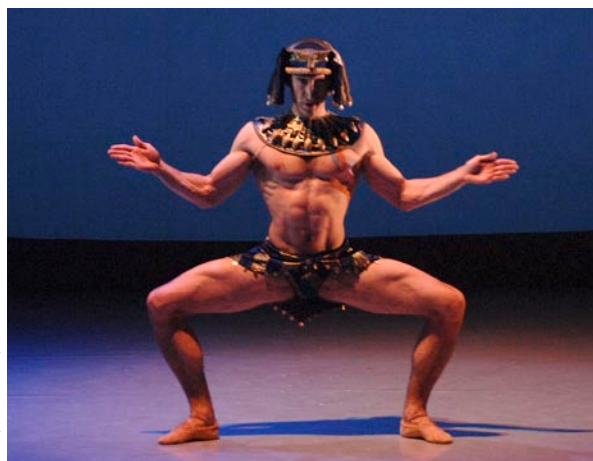
conception Yocom

Le Roi des rats est mort, Marie aime Casse-Noisette, le jeune homme retrouve son apparence et entraîne Marie dans la Valse des Fleurs. Mais toute histoire prend fin, Marie se retrouve curieusement seule auprès de son jeu de bois. Arrive alors Drosselmeyer accompagné de son neveu ; Marie reconnaît le jeune homme de son rêve.