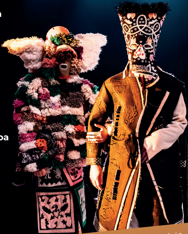
Illustration: L. P. Fogos et L. P. Fogos

Guichets des offices de tourisme d'Anglet, Bayonne et du Pays Basque